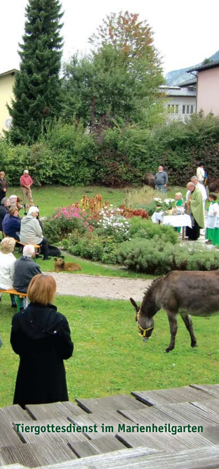
Tiergottesdienst im Marienheilgarten